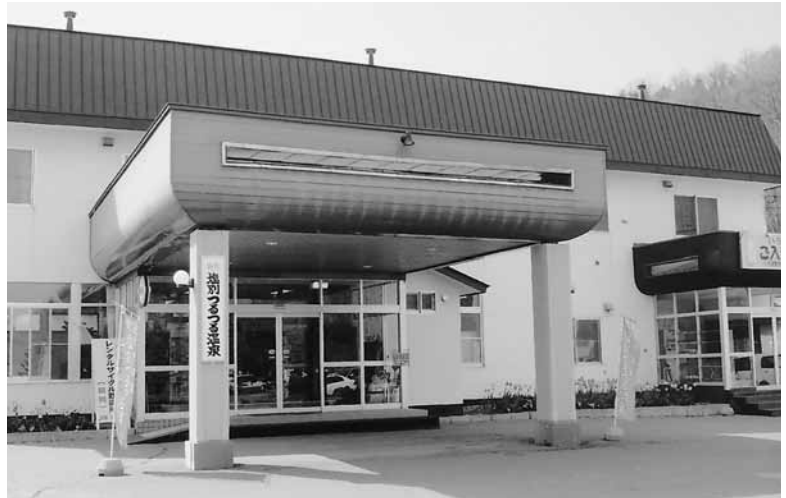
北見市内から車で約50分。北見市留辺薬町滝の湯201

癒し効果抜群です。男女別に用意されているのでいつでも楽しむことができるのもうれしい点です。お肌はつるつる心も癒され、北見支部が誇るおすすめの温泉です。