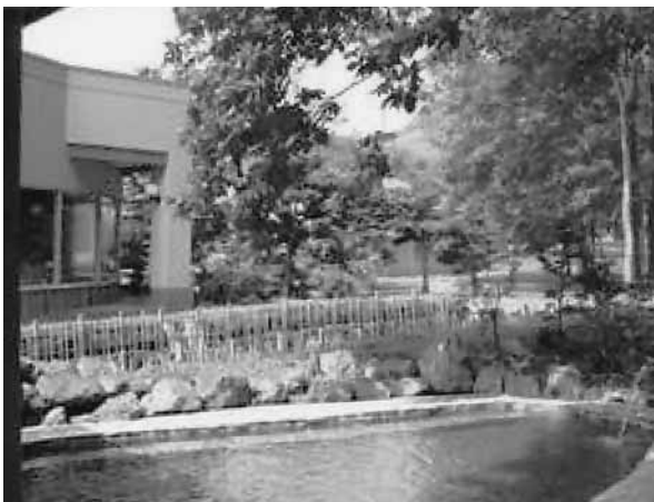
静かな森に囲まれ、川のせせらぎを聴く露天風呂

内風呂は大きな窓から四季を楽しむことができる景色の良い大浴槽が自慢です。また、打たせ湯、寝湯、ジャグジーも用意されており、お好みの湯を堪能することができます。皆さんご期待の露天風呂は静かな森に囲まれ、塩別川のせせらぎ、小鳥のさえずりも聞こえてくるというシチュエーション。