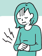
せいりつう 生理痛がひどい