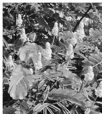
写真1. キャンドルブッシュ (参考資料1)より