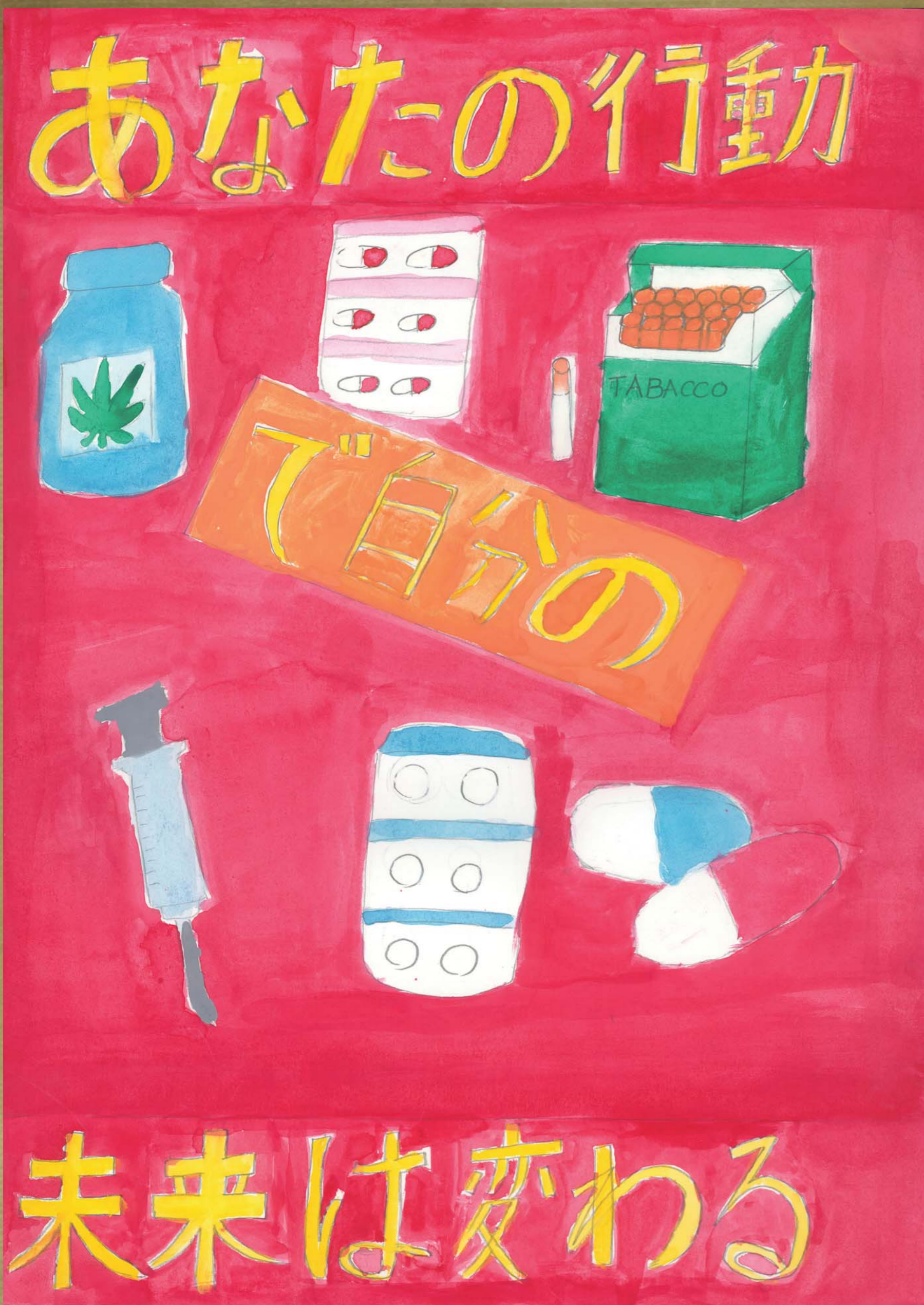
北海道薬剤師会会長賞