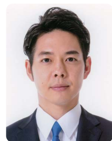
鈴木 直道 北海道知事